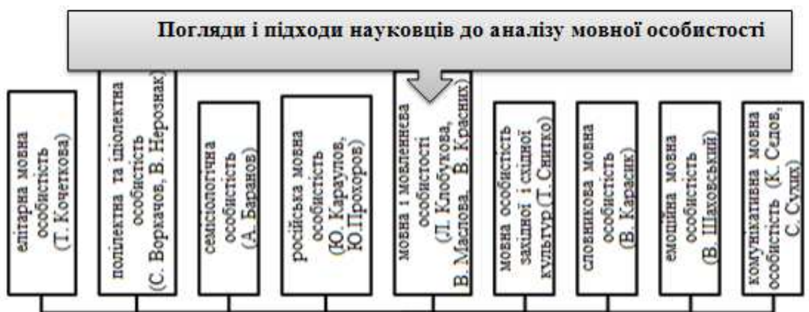
Рис. 1. Погляди і підходи науковців до аналізу мовної особистості

У сучасній лінгвістиці виокремилися різні напрями, погляди і підходи до аналізу мовної особистості (див. Рис. 1).