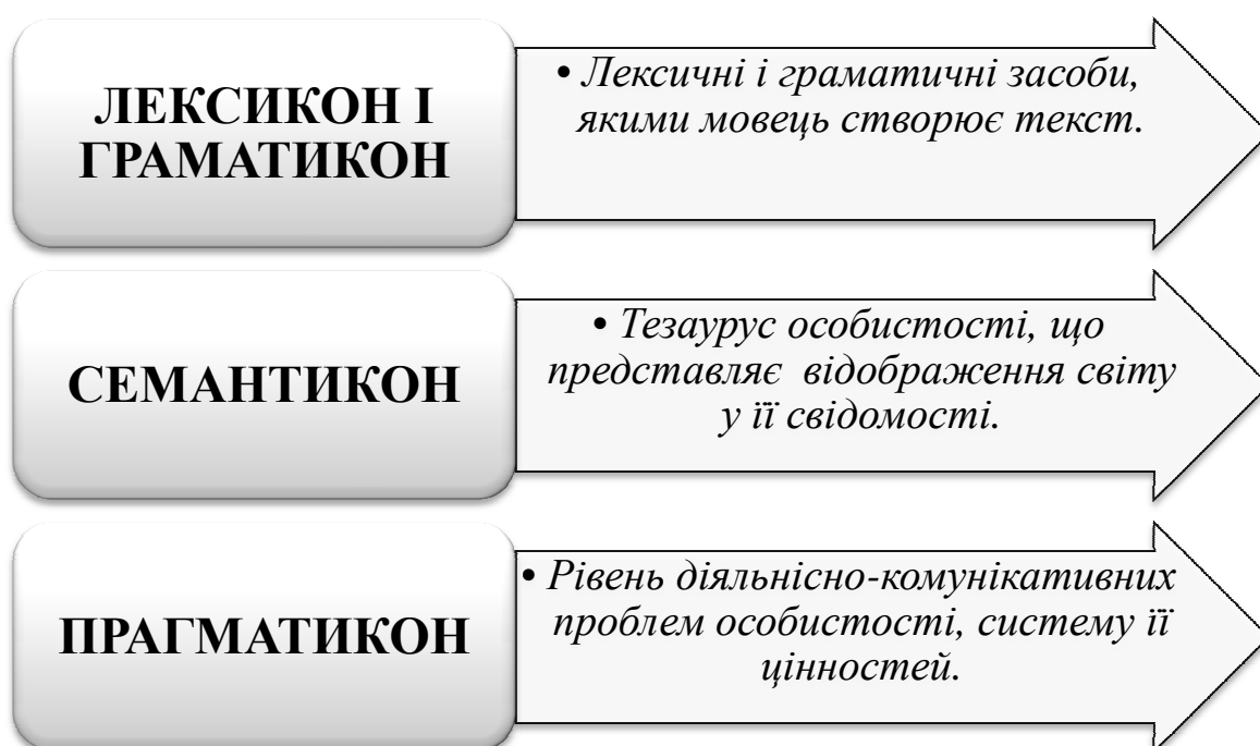
Рис. 3. Структура формування мовної особистості

Рівневу структуру формування мовної особистості умовно можна розшарувати на такі пласти, що забезпечують (див. Рис.3).