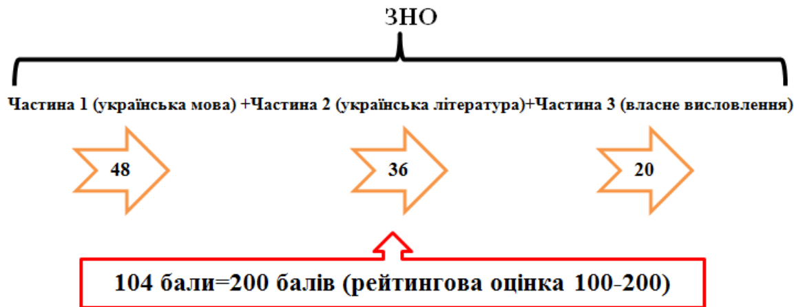
Рис. 1. Розподіл балів за виконання завдань тестового зошита з української мови і літератури (ЗНО)

Питання методики написання есе досліджували М. Балаклицький, О. Глазова, Н. Голуб, О. Горошкіна, Н. Дика, Г. Клочек, М. Пентилюк, Г. Шелехова, К. Шендеровський. Практичні поради педагогам містять статті й посібники вчителів Л. Тимощук, Г. Жукової, І. Голодюк та ін. [2, 78]