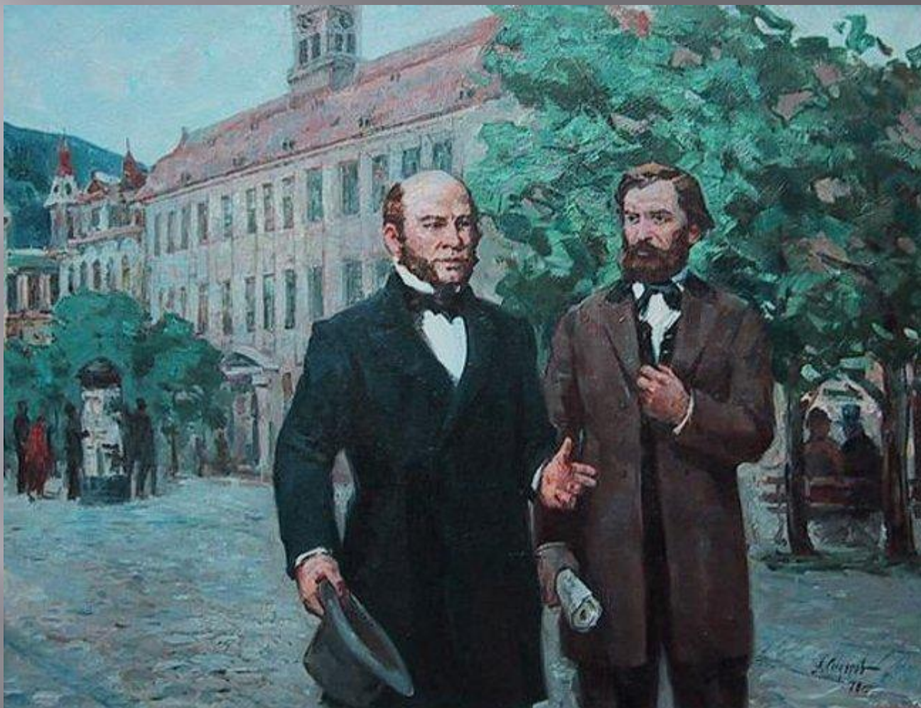
М. Пирогов і К. Ушинський