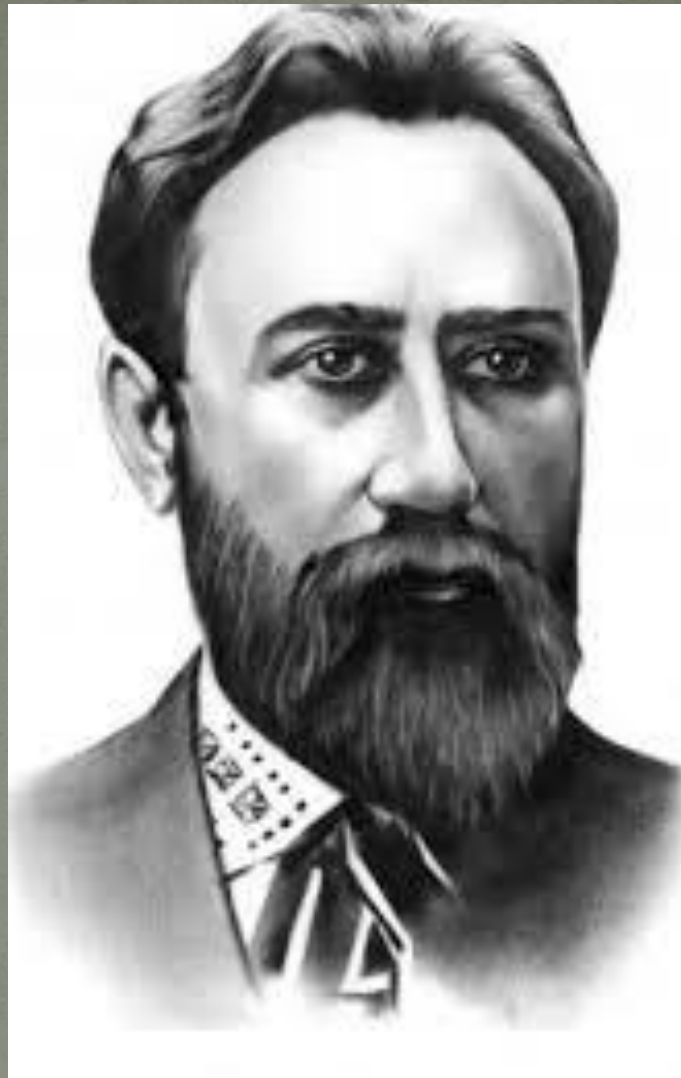
Б. Д. Грінченко (1863 - 1910 рр.)