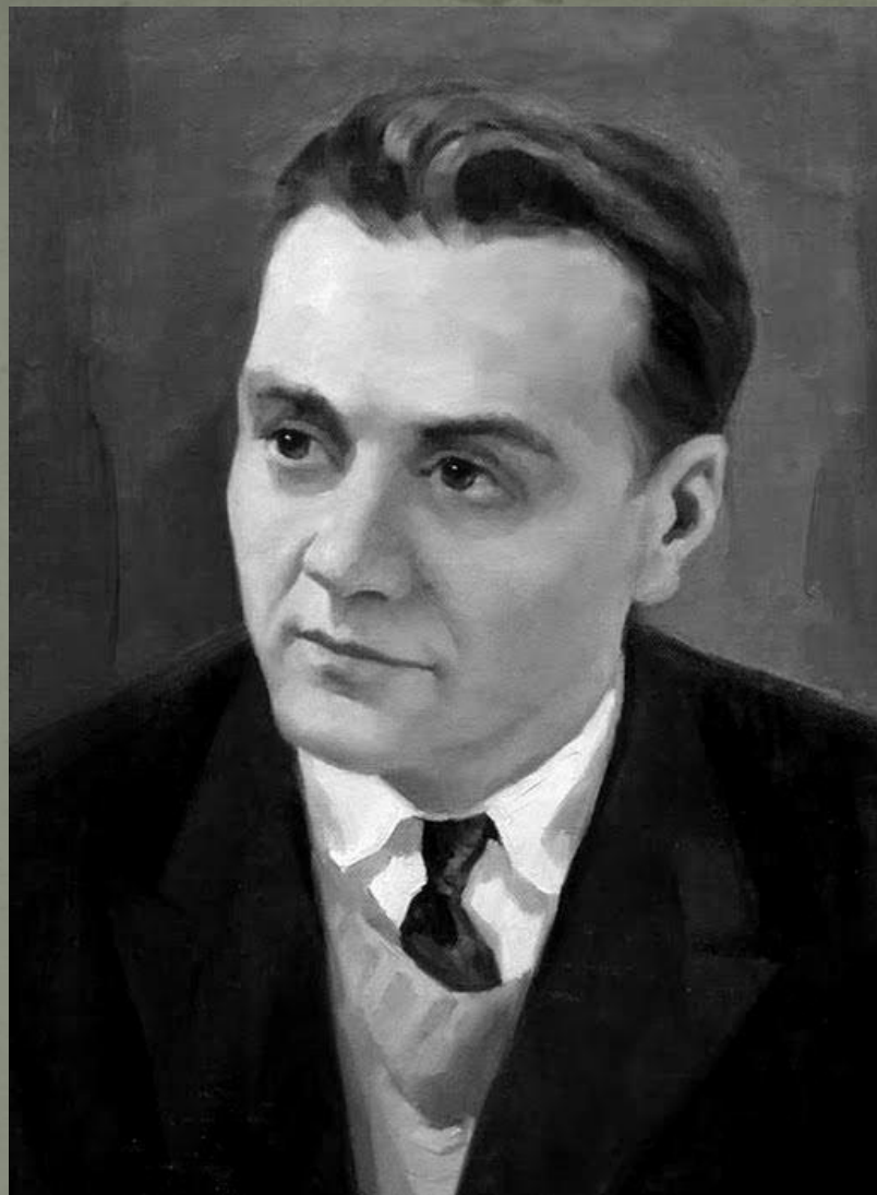
В. О. Сухомлинський (1918 - 1970 рр.)